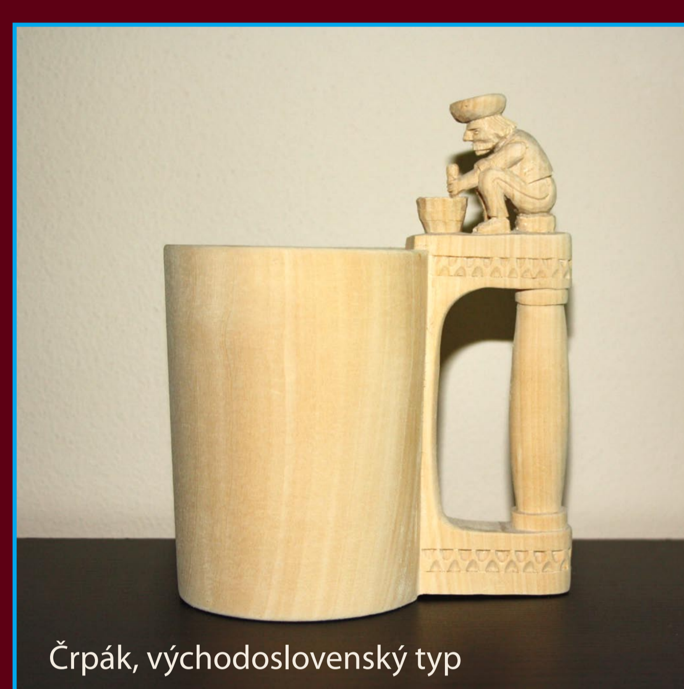
Črpák, východoslovenský typ

Východoslovenský typ, ktorý bol v minulosti charakteristický pre oblasť Gemera, Spiša, ale aj Horehronie, je podľa konštrukcie nazývaný celistvý . Je charakteristický zhotovením nádoby a ucha z jedného kusa dreva, ktoré je bez výzdoby, alebo geometricky či figurálne tvarované.