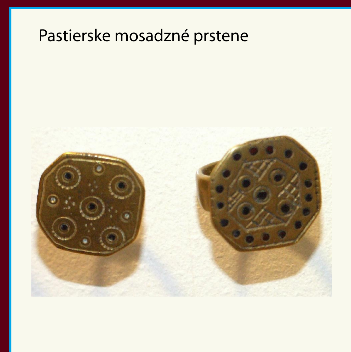
Pastierske mosadzné prstene