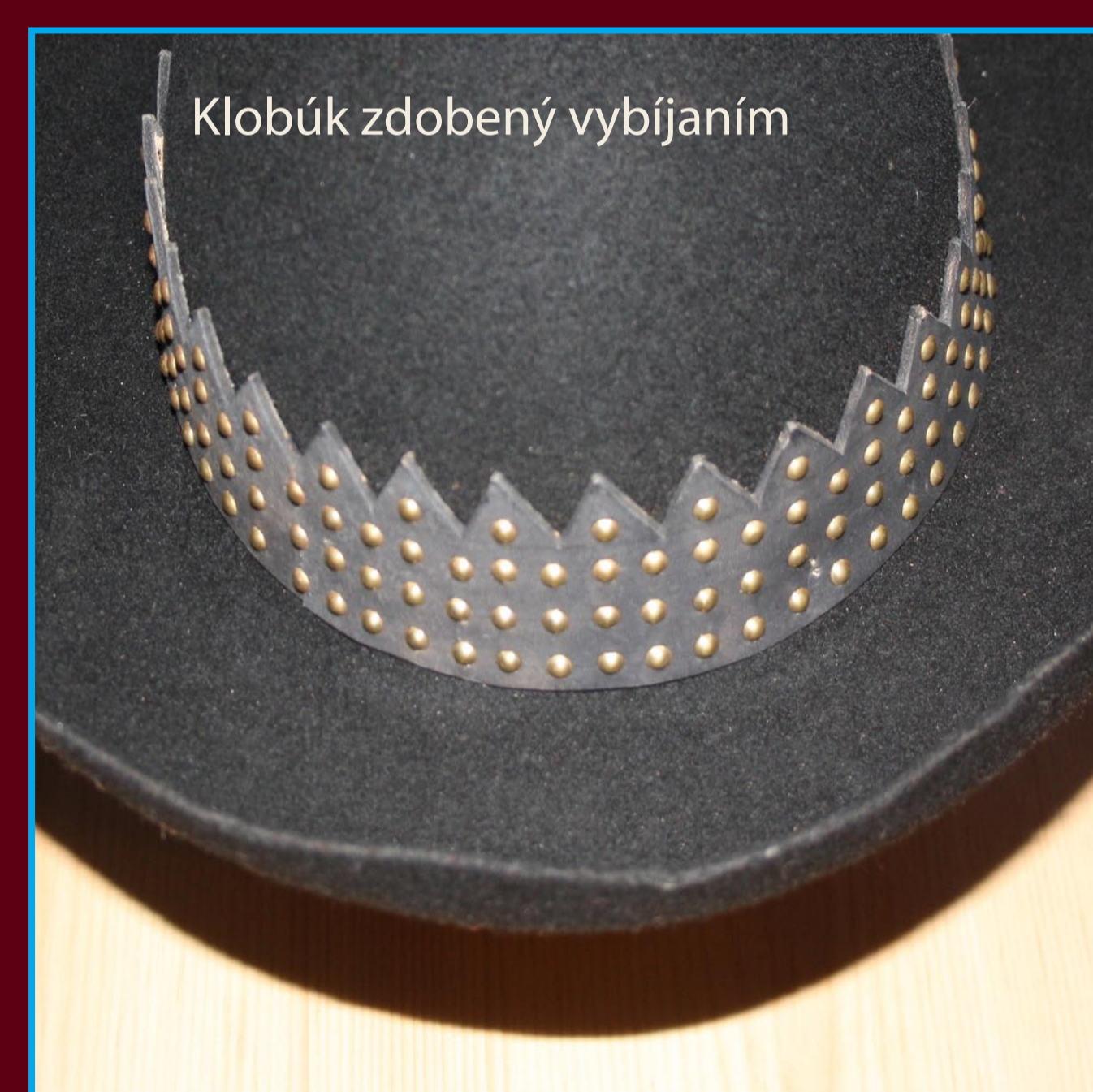
Klobúk zdobený vybijaním