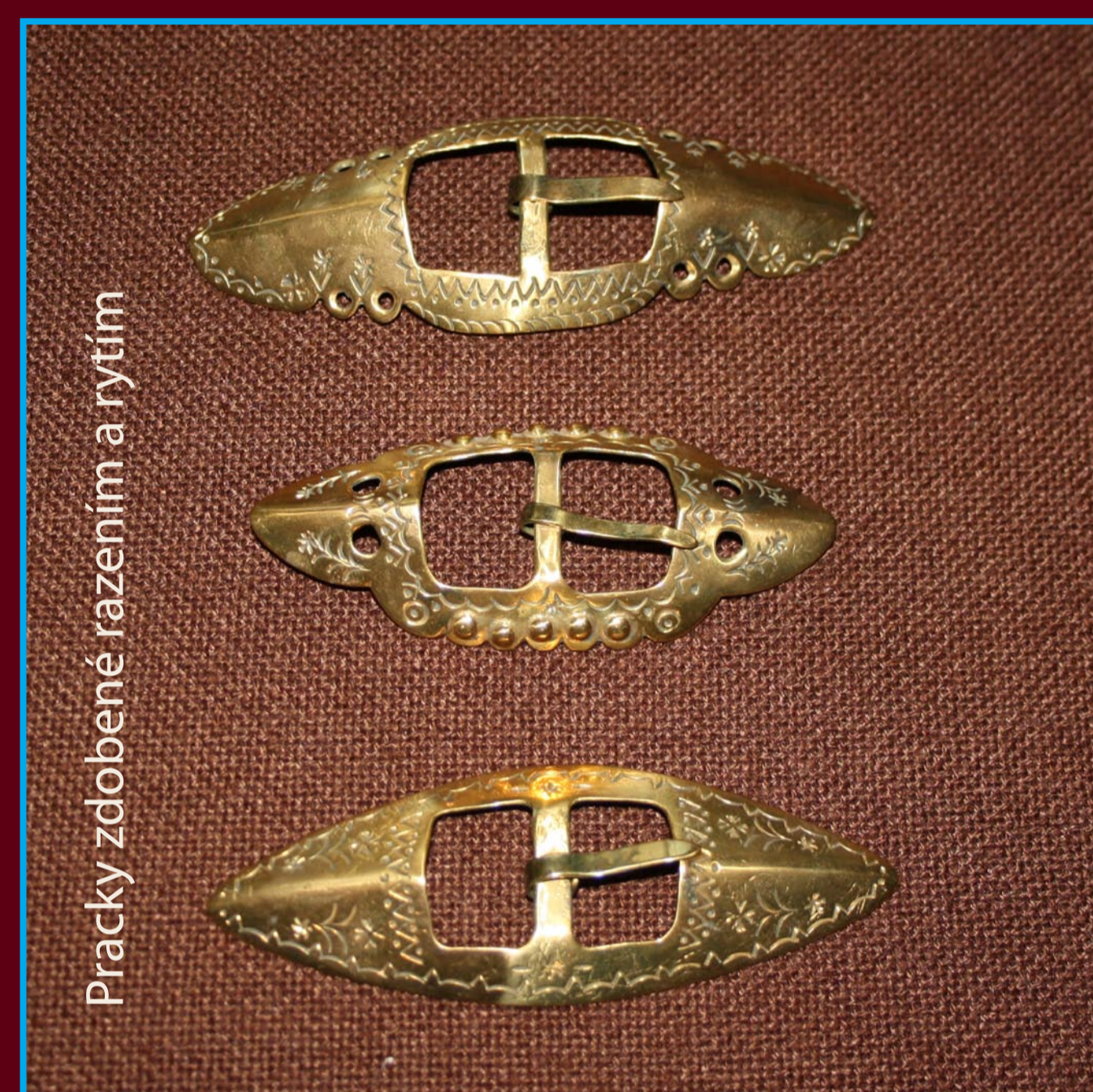
Pracky zdobené razeňím a rytím

V zbierkovom fonde Ovčiarskeho múzea ľudový šperk reprezentuje kolekcia praciek, spínadiel a ozdobných spôn puklíc , ktorá je tematicky spojená s pastierskou kultúrou a ovčiarstvom.