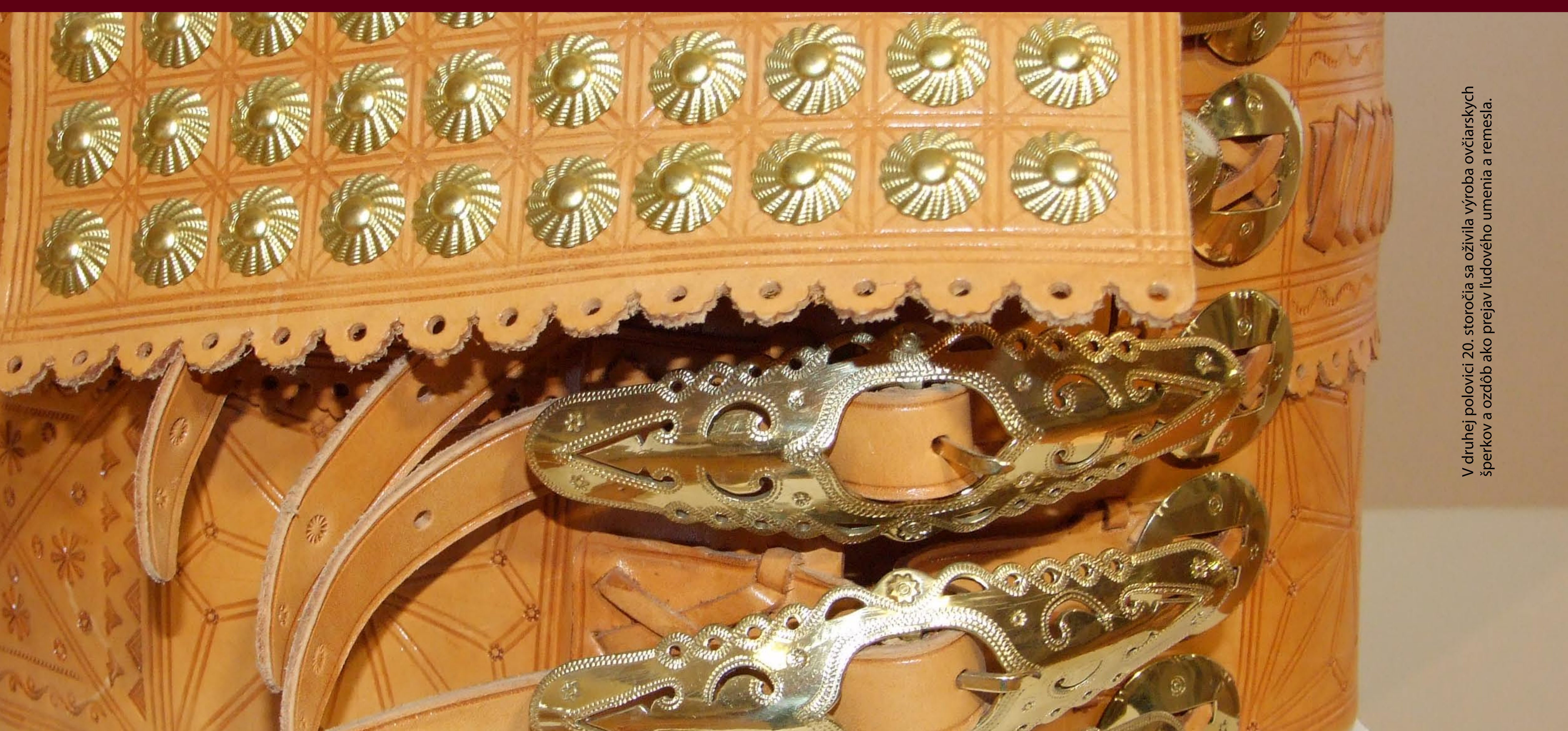
V druhej polovici 20. storočia sa oživila výroba ovčiaršských šperkov a ozdôb ako prejav ľudového umenia a remesla.

🇬🇧 Metal accessories belonged to the clothing of sheep shepherds. They were made by them and distinguished them from livestock shepherds who were not allowed to wear them. Such accessories were part and parcel of leather bags, belts and hats. Their ornamentation, shape and location were different in every region. Shirt pins and brass rings were worn by chief shepherds in the Liptov region. Making of shepherd accessories was revived in the form of folk crafts in the second half of the 20th century.