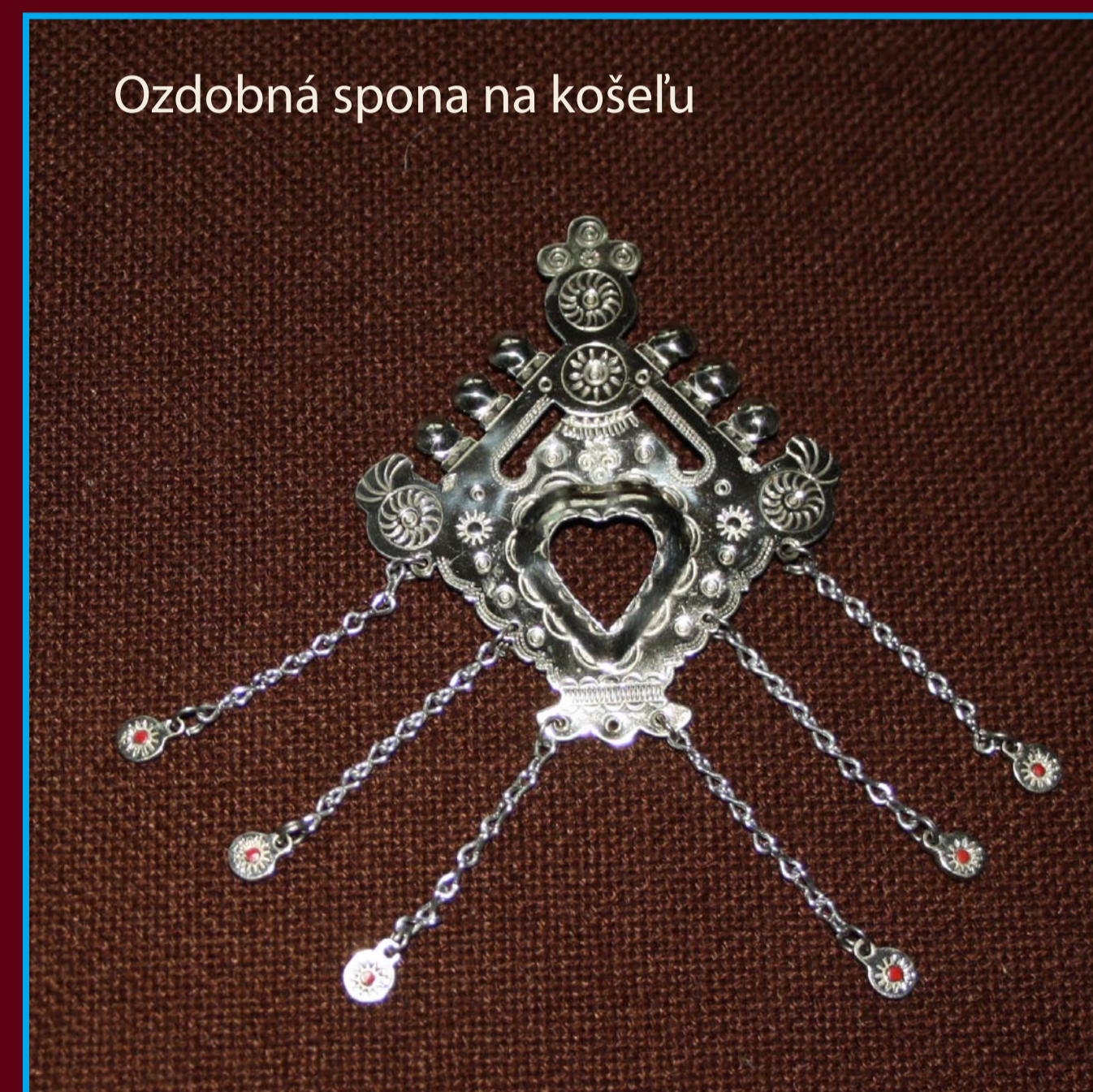
Ozdobná spona na košelu