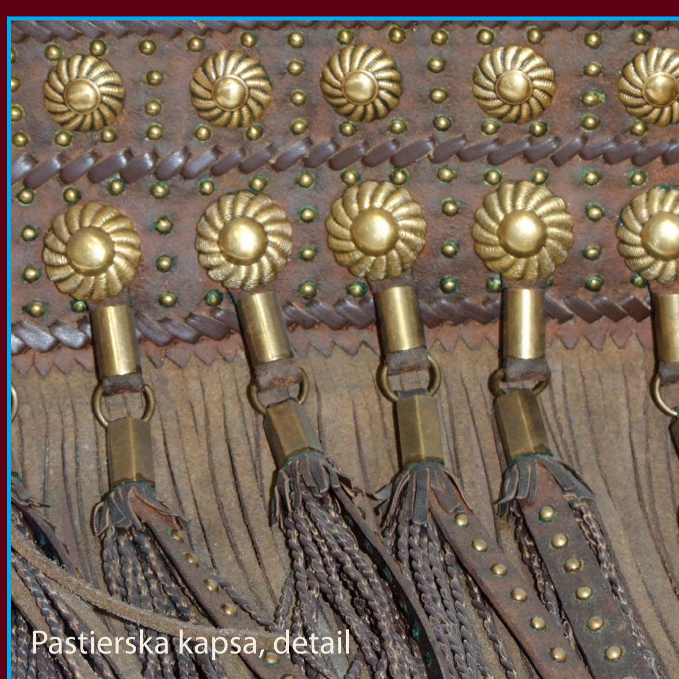
Pastierska kapsa, detail